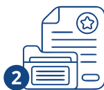
2 Документтерди даярдоо