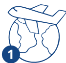
1 Россияга келүү

Ишке патенттин мөөнөтү 12 айга чейин чектелген. Төлөм патент жарактуу болгон ар бир ай үчүн жүргүзүлөт. Эгер патентти убагында төлөбөсөңүз – ал күчүн жоготот!