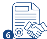
6 Жумушка алуу