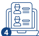
4 Документтерди тапшыруу