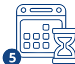
5 Патент алуу